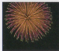
ゲレンデ近くで打ち上げられる花火は迫力満点!