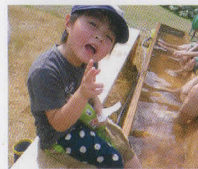
真夏でも雪はやっぱり冷たい! お湯に足を浸けてあったまろう。

檜枝岐温泉スキー場では、毎年春、降り積った雪を特殊なシートで包んで保存し、8月に開放。イベント当日は、雪のゲレンデの傍らにカラフルなパラソルが花咲き、半袖の子どもたちが雪そりで滑り降りるといって、なかなかお目にかかれない光景が広がります。