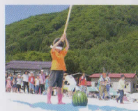
真夏ならではの! 足元ひんやり、雪上でのスイカ割り大会

全国屈指の豪雪地帯として知られる檜枝岐村。「降り積もる雪を何かに活用できないだろうか。今年で25回目を迎える「真夏の雪まつり」は村のそんな思いから始まりました。会場となる尾瀬