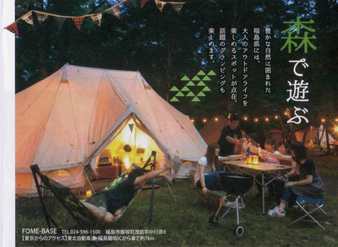
FOME-BASE TEL.024-596-1500 福島市飯坂町茂庭字中川原6 【東京からのアクセス】東北自動車道・福島飯坂ICから車で約7km

豊かな自然に囲まれた福島県には、大人のアウトドアライフを楽しめるスポットが点在。話題のグランピングも楽しめます。