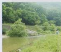
川のせせらぎに癒されたり、釣りを楽しむも素敵。

もちろん、今話題のグランピングを楽しめるスポットも、「グラマラス」と「キャンピング」を組み合わせた「グランピング」は、テントを張ったり、キャンプ道具を持参したりしなくても、気軽に、そして快適にキャンプを楽しむ新しいキャンプスタイル。手ぶらで楽しめるだけでなく、リゾート