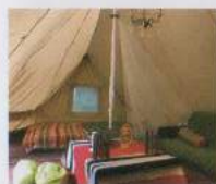
レトロなシャンデリアがかわいい、エスニック調にコーディネートされたテント内。

のような非日常的な雰囲気の魅力。テント内にはベッドやテーブルが用意され、虫の声をせせらぎなど、自然を体感しながらも快適で贅沢な時間を過ごすことができます。