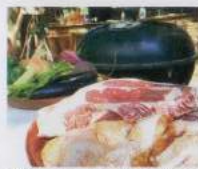
立派なステーキを豪快に焼いてビールと一緒に楽しもう。