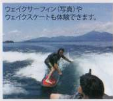
ウェイクサーフィン(写真)やウェイクスケートも体験できます。

もっと爽快感を味わいたい方には、ボードに引かれながら、ボードの上で立って水面を疾走するウェイクボードがおすすめ。波の穏やかな湖は初トライに最適です。