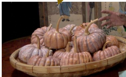
会津エリア産 会津伝統野菜

これだけのクオリティのみしらず柿を初めて賞味した ドライフルーツは渋戻りもなく漂白したようにきれいでびっくり (宿泊業)