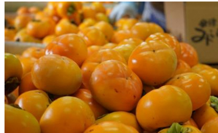
会津若松市産 みしらず柿