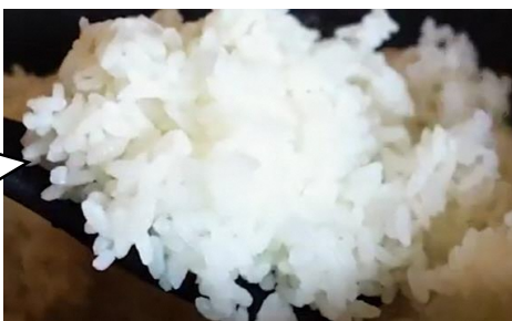
福島市産 オリジナル米 (天のつぶ)

お米を「バリカタ」と表現していて、「喉ごしの良い」というPR方法が響いた (飲食業)