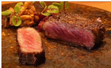
二本松市産 経産牛、短黒牛

ECサイトを立ち上げたのでそこでプレミアム感ある牛肉とし取り扱いたい (量販店)