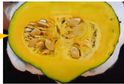
南相馬市産 かぼちゃ (黄色いハート)

手間を惜しまず美味しいと言って貰えるよう努力を重ねていく姿に感銘を受け、本当の南瓜を知った (宿泊業)