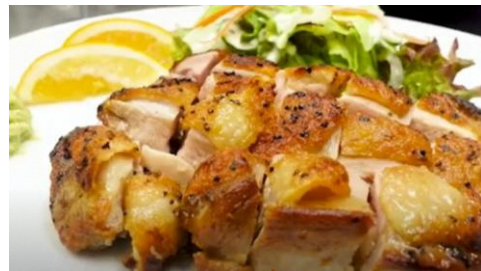
川俣町産 川俣シャモ

お米を「バリカタ」と表現していて、「喉ごしの良い」というPR方法が響いた (飲食業)