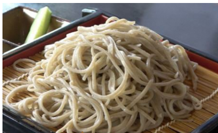
喜多方市産 山都そば

肉の旨味最高 うちの調理方法でなら更にお客様にこの旨味を活かした調理方法にて提供できると思う (宿泊業)