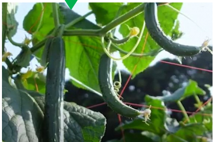
三春町産 きゅうり

手間を惜しまず美味しいと言って貰えるよう努力を重ねていく姿に感銘を受け、本当の南瓜を知った (宿泊業)