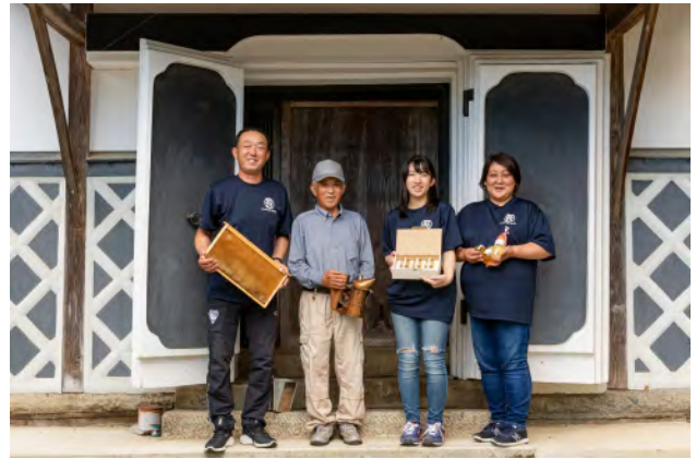
[夏] 伊達市月舘町 MARUCHO FARM