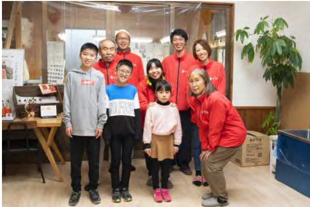
[春] 伊達市霊山町 株式会社松葉園

「旬」のくだものを使用した 季節を感じる焼菓子 生産者の想いを知りつつご購入いただける場を 銀座6丁目に用意いたしました