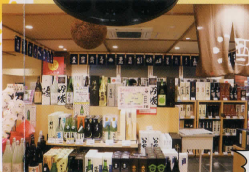
福島県産酒は、全国新酒鑑評会の 金賞受賞数が5年連続日本一!